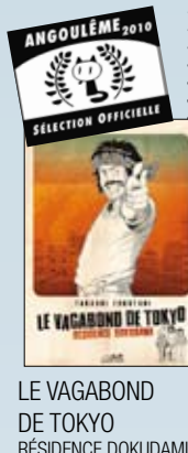
LE VAGABOND DE TOKYO RÉSIDENCE DOKUDAMI